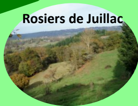
Rosiers de Juillac

Convivialité, partage et respect de la nature sont les valeurs de cet évènement