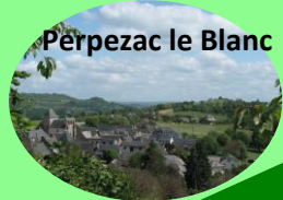
Perpezac le Blanc

Un rendez-vous pour faire le plein d'émotions !